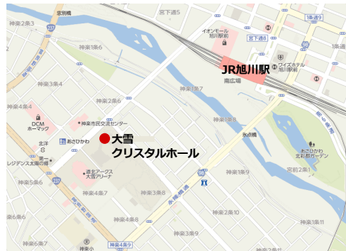
旭川市国際会議場