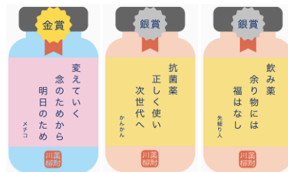
昨年の入選作品例