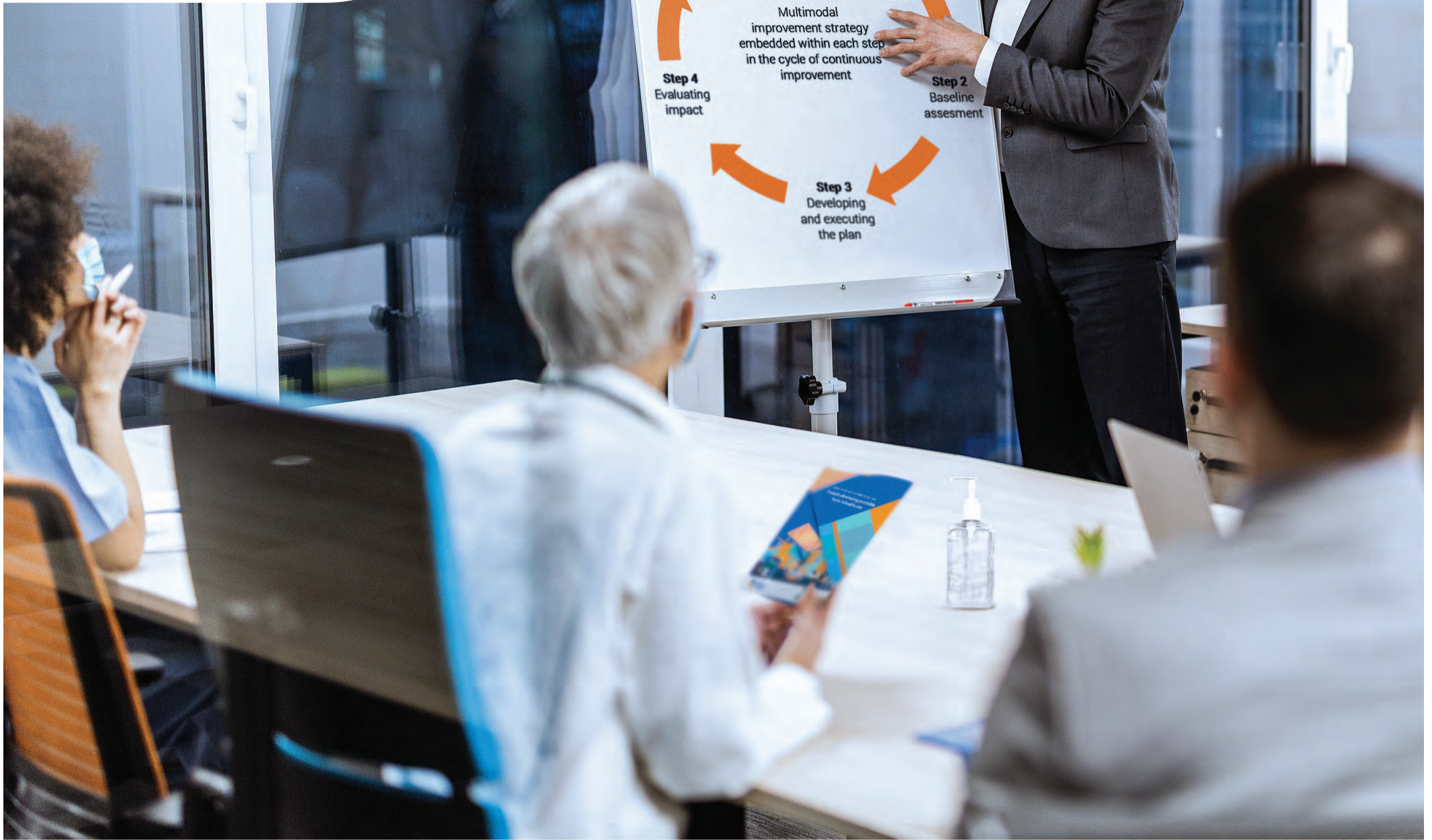
Figure 2. Steps of implementation