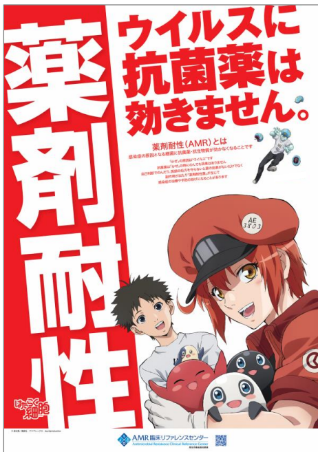
ポスター (B3 364×515mm)